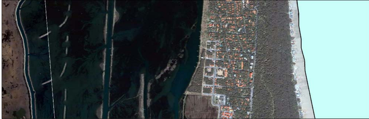
La Morfotipologia paesistica ricorrente A3 è esplicativa della relazione di fra trame agricole e pineta costiera.

A3 MORFOLOGIA COSTIERA CARATTERIZZATA DA UNA SEQUENZA TRASVERSALE RICORRENTE COMPOSTA DA BONIFICHE CON RETE REGOLARE DI STRADE E CANALI A MAGLIE LARGHE, EVENTUALE PINETA, CORDONE DUNALE E ARENILE