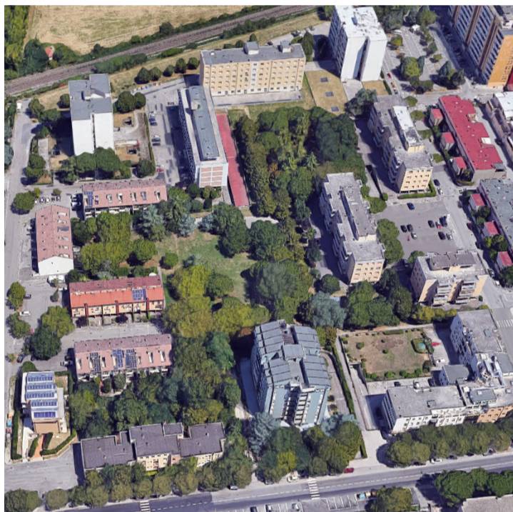
Una veduta area dell'area interessata dal progetto di riqualificazione

glioramento delle condizioni di accessibilità e della sicurezza degli spazi e degli edifici pubblici. È previsto che gli interventi inseriti nel programma siano realizzati in cinque anni. Per attuare il programma si è scelto di attivare un concorso di progettazione su due livelli che interessi l'intero comparto, coordinato dal Comune di Ravenna, con la collaborazione dell'Ordine provinciale degli architetti, pianificatori, paesaggisti e conservatori per il coordinamento del concorso di progettazione relativo alla rigenerazione sociale degli edifici.