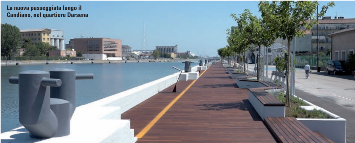
La nuova passeggiata lungo il Candiano, nel quartiere Darsena

Monitorare i parametri energetici (consumi, kWh) e di qualità dell'aria (anidride carbonica, temperatura, agenti inquinanti ecc.) è una attività di rilevanza fondamentale per gli edifici esistenti - che costituiscono la maggior parte del patrimonio edilizio - in quanto rappresenta il punto di partenza per attivare il cambiamento in termini comportamentali e di gestione e in termini di riqualificazione. È quindi questa la direzione verso cui punta l'azione pilota nell'ambito del progetto, anche alla luce dei recenti incentivi fiscali per le famiglie previsti dal Superbonus 110% per gli interventi di efficientamento energetico.